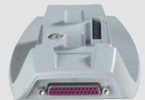
Optional für WLAN und parallele I/O.