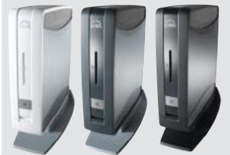
weiß dunkelblau schwarz